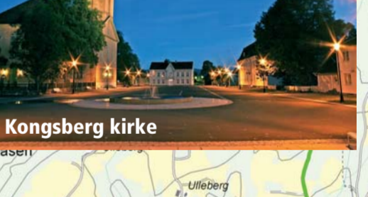
16 Kongsberg kirke