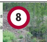
8 Jølets gruve