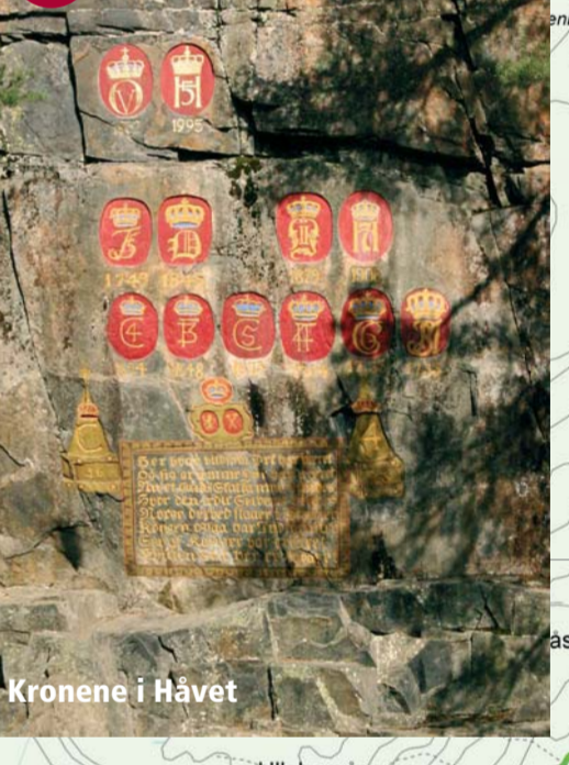
15 Kronene i Havet